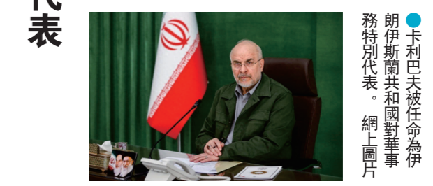
●卡利巴夫被任命為伊朗伊斯蘭共和國對華事務特別代表。

伊朗伊斯蘭共和國廣播電視台16日就霍爾木茲海峽局勢報導，歐洲方面已開始就海峽通航問題，與伊朗伊斯蘭革命衛隊海軍展開接觸與協調。