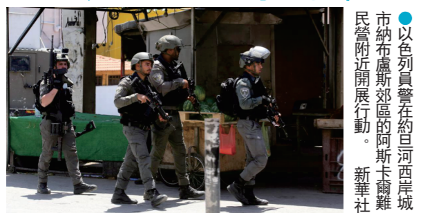
●以色列軍警在約旦河西岸城市納布盧斯地區的阿斯卡爾難民營附近開展行動。

以色列制定的「巴勒斯坦人死刑法」17日夜間生效。該法授權法官對其認定實施「致命襲擊」的約旦河西岸巴勒斯坦人判處死刑，被批為針對巴勒斯坦人的歧視性法律，廣受譴責。