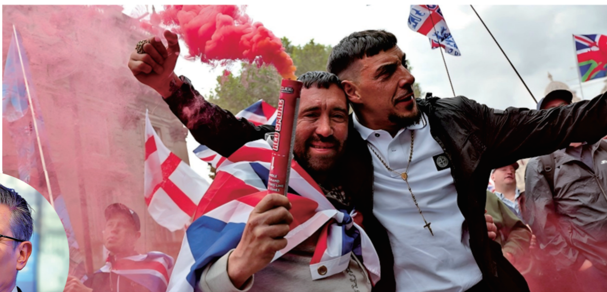
●有示威者穿着反特朗普、反內塔尼亞胡及反愛滋斯坦囚服。