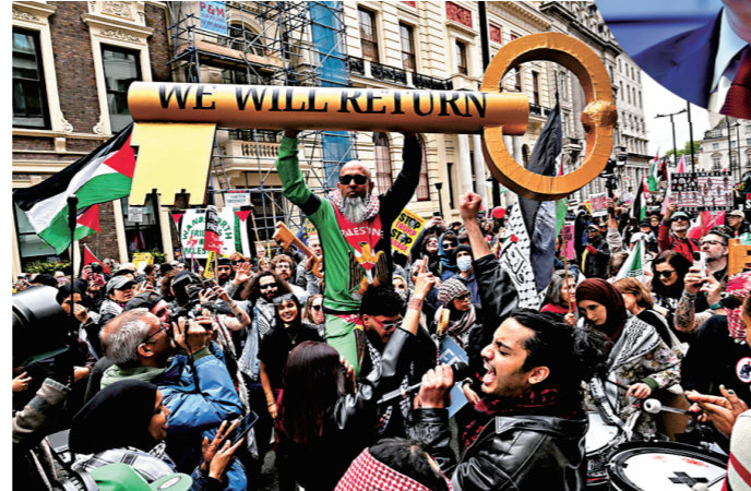
●一名示威者手持寫着「我們會重來」的鑰匙道具。