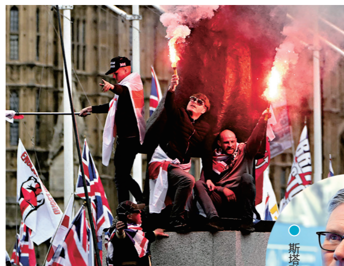
●「團結王國」示威者在邱吉爾像旁燃放焰火。

報道還稱，被認為是壓垮斯塔默的最後一根稻草，是財相里夫斯日前受訪時，刻意使用「我」而非「首相與我」的慣用表述，分析認為這可能是暗示與斯塔默保持距離。有支持斯塔默的官員稱，部分表面力撐他的內閣高官，實則已暗中游說黨友倒戈，甚至考慮為新黨魁就任後鋪路政治交接事宜。