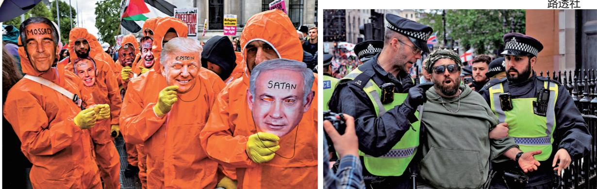
●一名示威者被警方帶走。