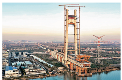
●合湛高鐵路將連接深湛高鐵路等線路。圖為深湛高鐵路深江段建設現場。

漳汕高鐵路東段近日也全面啟動橋樑架設施工，計劃於2028年全線建成開通，屆時實現高鐵路從廈門2個多小時直達廣州，較現在省時近一半。國鐵廣州局表示，漳汕高鐵路通車後，將與福廈高鐵路、廣汕高鐵路等共同組成沿海大通道，將打通「廣州—汕頭—漳州—廈門—福州」東南沿海高鐵路客運通道的關鍵節點，對於打破區域高鐵路發展「瓶頸」具有重要意義。