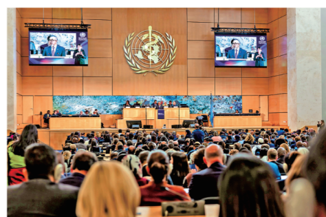
●第79屆世界衛生大會18日開幕，拒絕將個別國家提出的所謂涉台提案納入大會議程。

相，是因為多年來中國中央政府已經對台灣地區參與全球衛生事務作出妥善安排，所謂「國際防疫體系缺口」完全是政治謊言。在一個中國原則前提下，台灣地區的醫療衛生專家可以參與世衛組織相關技術會議。在《國際衛生條例》框架下，台灣地區設有聯絡點，能夠及時獲取世衛組織發布的突發公共衛生事件信息，也能及時向世衛組織通報。