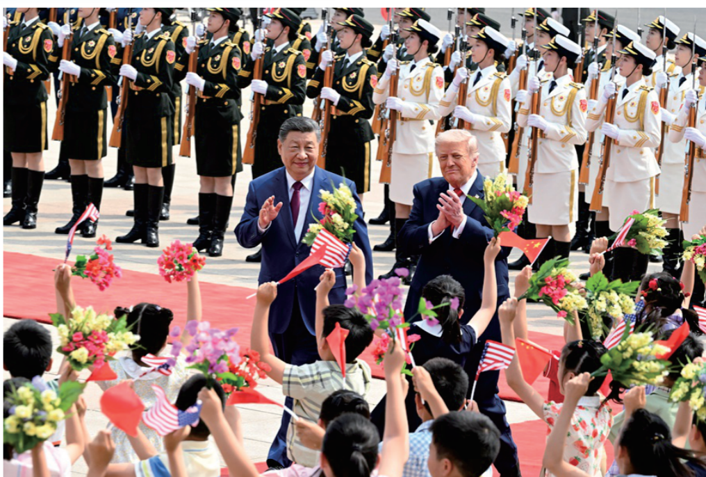
▲中美元首會晤牽動全球目光。圖為5月14日上午，國家主席習近平在北京人民大會堂東門外廣場為美國總統特朗普舉行歡迎儀式。

14日的中美元首會談期間，一個畫面迅速刷屏全球：特斯拉首席執行官馬斯克、蘋果首席執行官庫克、英偉達首