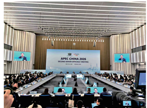
●亞太經合組織第二次高官會議在滬開幕。

【本報訊】18日，2026年亞太經合組織第二次高官會議在上海開幕。今年是APEC中國年，這是中國時隔12年再度擔任APEC東道主，也是上海時隔25年再次迎來APEC重要會議。外交部副部長馬朝旭在開幕式上表示，這是一次承前啟後的會議，各方將在此盤點年中進展，細化成果設計，匯總早期收穫，為下半年各場重要活動，特別是深圳的領導人非正式會議的成果打牢基礎。